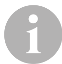
TABELA ZASTOSOWAŃ PRODUKTÓW